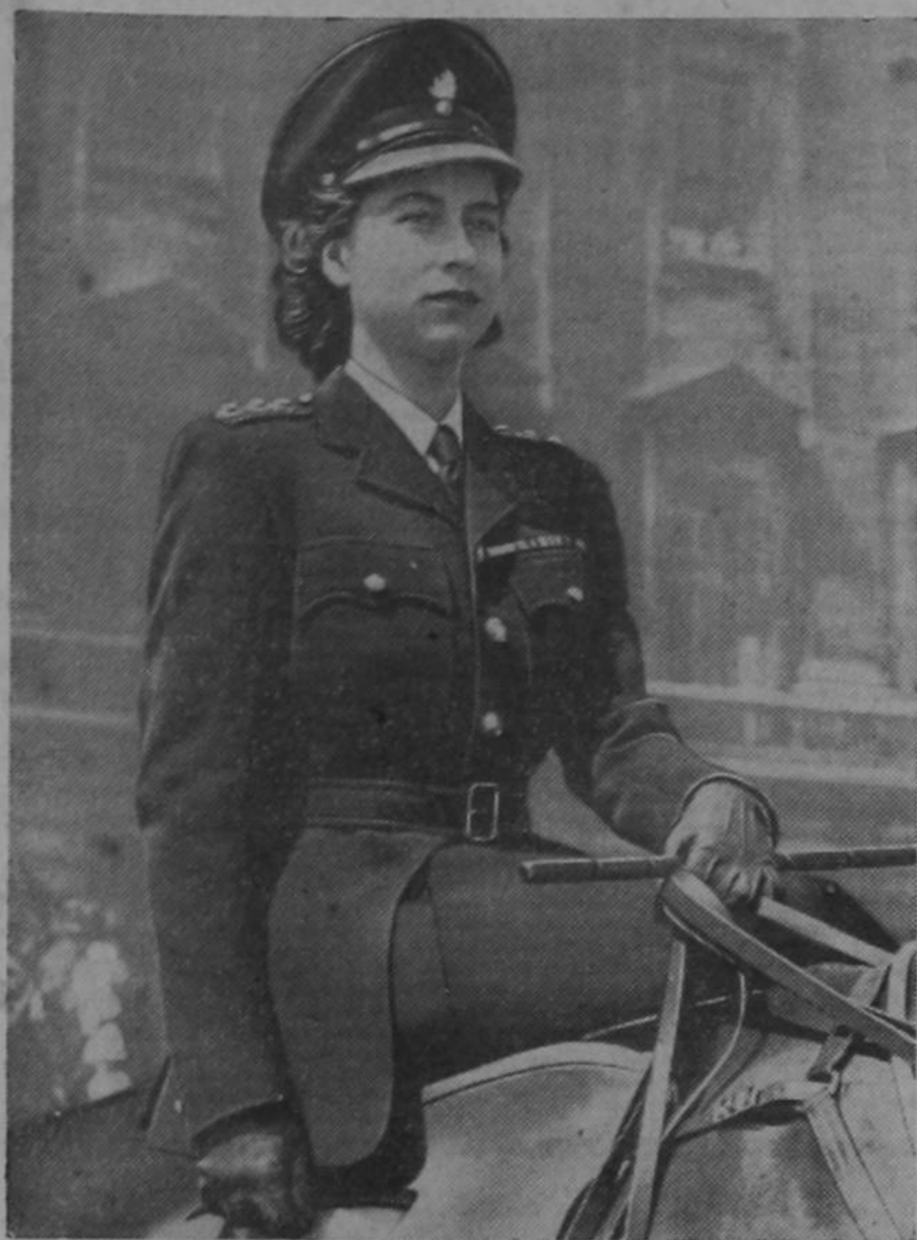
S. A. Real Isabel de Inglaterra, cuyo boda con el teniente Felipe Mountbatten, se efectuará el jueves próximo, siendo este un acontecimiento que ha hecho converger hacia la casa real inglesa las simpatías de todo el mundo.